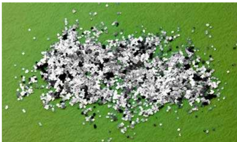
[ Arséniure de gallium ]

En règle générale, l'arséniure de gallium est déposée en une seule couche mince sur un wafer de petite taille. Le dispositif peut être conçu directement sur le wafer, ou sur la plaquette de semi-conducteur découpée dans la taille désirée. Les chercheurs de l'Illinois ont décidé de déposer des couches multiples de matière sur une seule plaquette, créant au final un empilement d'arséniure de gallium.